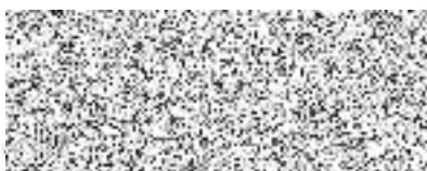
za příjemce Milan Rybánský