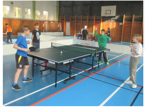
Více fotografií z akcí školního klubu KOTVA můžete shlédnout na školním webu v sekci „fotogalerie“.