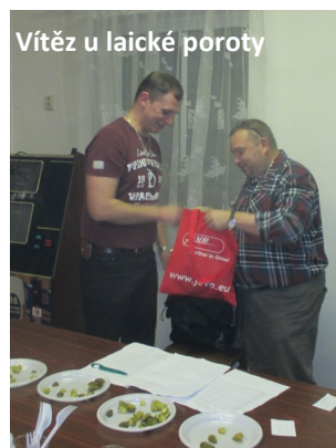
Vítěz u laické poroty