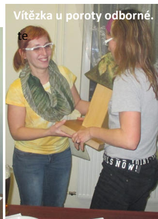
Vítězka u poroty odborné.