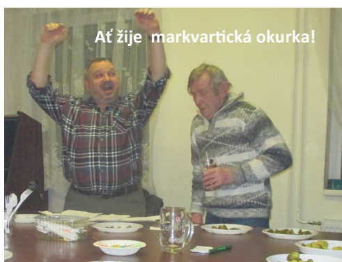
Ať žije markvartická okurka!