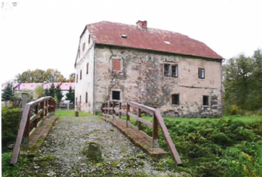
Červený dvůr – památka, o jejíž opravu bude ZO také usilovat